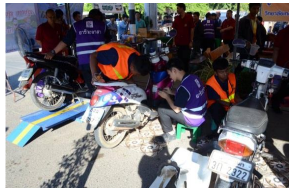
วิทยาลัยเทคนิคยโสธร เปิดศูนย์ ตรวจรถก่อนใช้เดินทางปลอดภัย อาชีวะอาสา ร่วมกับ กรมการขนส่งทางบกจังหวัดยโสธร จัดตั้งศูนย์ตรวจซ่อมรถบริการถ่ายน้ำมันเครื่องฟรี ระหว่างวันที่ 29 ธันวาคม 2558 ถึง วันที่ 4 มกราคม 2559 โดยมีวัตถุประสงค์เพื่อรณรงค์ป้องกันและลด อุบัติเหตุทางถนนและสร้างจิตสำนึกให้ประชาชนหันมาใส่ใจตรวจความพร้อมของรถทุกครั้ง ก่อนเดินทางและเพื่อ พัฒนาการเรียนรู้ การฝึกทักษะให้นักเรียนและนักศึกษา