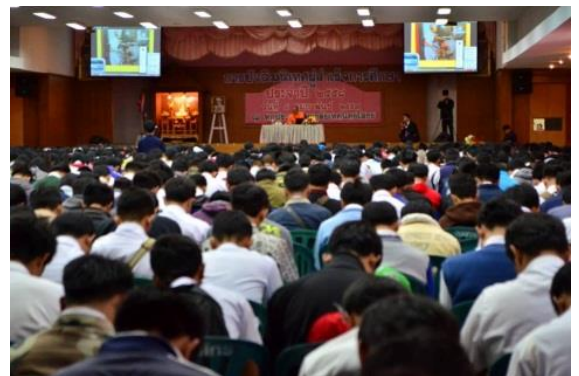
เมื่อวันที่ 4 กุมภาพันธ์ 2559 วิทยาลัยเทคนิคยโสธร จัดกิจกรรมการปัจฉิมนิเทศผู้สำเร็จการศึกษา ประจำปีการศึกษา 2558 ผู้สำเร็จการศึกษารับฟังธรรมบรรยาย "ธรรมแสงส่องทาง สู่ความสำเร็จ บรรยายธรรม โดย พระมหาสมปอง ตาลปุตฺโต ฌ หอประชุมวิทยาลัยเทคนิคยโสธร