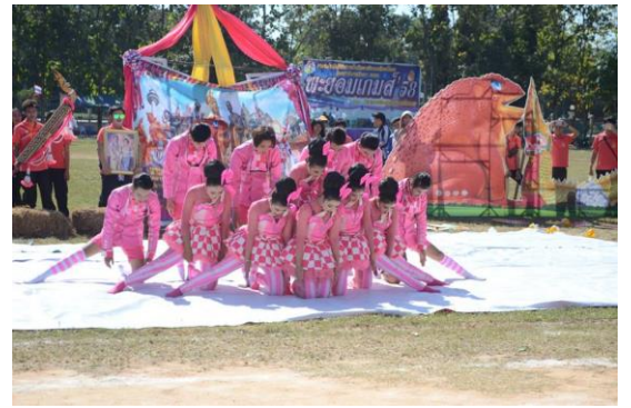
วันที่ 27 พฤศจิกายน 2558 Sport Day การแข่งขันกีฬาภายใน วิทยาลัยเทคนิคยโสธร