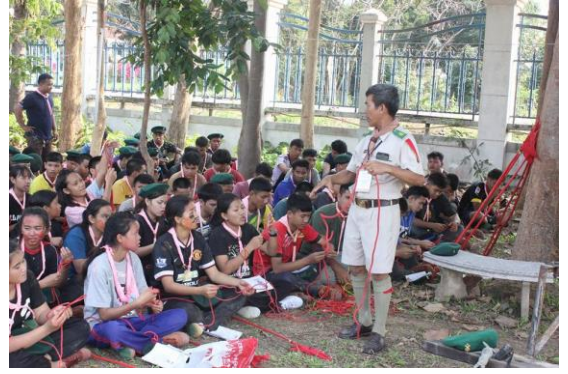
วิทยาลัยเทคนิคยโสธร จัดกิจกรรมเดินทางไกล เข้าย้ายพักแรม กองลูกเสือวิสามันธุ์ ระหว่างวันที่ 22 - 24 มกราคม 2559 ณ ค่ายลูกเสือจำลองวิทยาลัยเทคนิคยโสธร