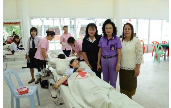
คณะครู บุคลากร เจ้าหน้าที่ นักเรียนนักศึกษา ร่วมบริจาคโลหิต เพื่อการกุศลกับทางโรงพยาบาลโยธา และเหล่ากาชาดจังหวัดโยธา ณ ห้องประชุมศูนย์เพื่อนใจ TO BE NUMBER ONE วิทยาลัยเทคนิคโยธา ในวันที่ 28 สิงหาคม 2558