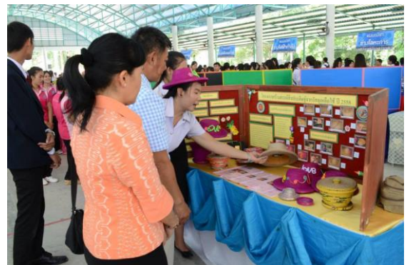
กิจกรรมงานวันวิทยาศาสตร์ "สุดยอดนวัตกรรม อาชีวศึกษา 58 วิทยาลัยเทคนิคโยธา วันที่ 18 สิงหาคม 2558 การประกวดโครงงานวิทยาศาสตร์ คณิตศาสตร์ และสิ่งประดิษฐ์ของคนรุ่นใหม่ "