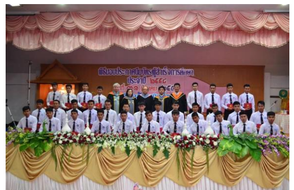
วันที่ 31 มีนาคม 2559 พิธีมอบประกาศนียบัตรผู้สำเร็จการศึกษา ประจำปีการศึกษา 2558 วิทยาลัยเทคนิคยโสธร ได้รับเกียรติจาก นายนิยม ศรีวิเศษ นายกสภาสถาบันการอาชีวศึกษา ภาคตะวันออกเฉียงเหนือ 4 เป็นประธานมอบประกาศนียบัตร ครั้งที่ ฌ หอประชุมวิทยาลัยเทคนิคยโสธร