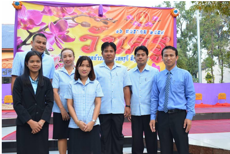
งานวันครู จังหวัดยโสธร ครั้งที่ 60 ประจำปี 2559 วันเสาร์ที่ 16 มกราคม พ.ศ. 2559 ณ หอประชุมวิทยาลัยเทคนิคยโสธร