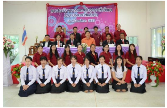
วิทยาลัยเทคนิคโยธา รับการตรวจประเมินคุณภาพภายในการอาชีวศึกษาโดยหน่วยงานต้นสังกัด ประจำปีการศึกษา 2557 วันที่ 8 กรกฎาคม 2558 ณ ห้อง TO BE NUMBER ONE วิทยาลัยเทคนิคโยธา